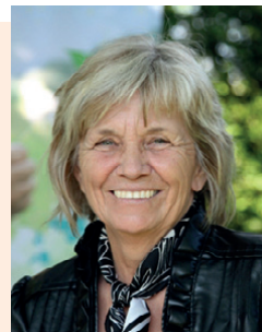
Manuela Schwesig Ministerin für Arbeit, Gleichstellung und Soziales Mecklenburg-Vorpommern

Die Gesellschaft für Suizidprävention feiert ihr 40-jähriges Bestehen. 40 Jahre, in denen sie Menschen geholfen hat. Sowohl denen, die suizidgefährdet waren, aber auch den Angehörigen von Suizidopfern. Ich bedanke mich bei allen, die in diesen vier Jahrzehnten in den meisten Fällen ehrenamtlich diese schwierige Arbeit geleistet haben.